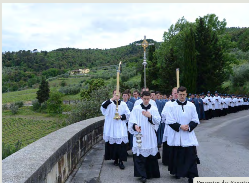
Procession des Rogations