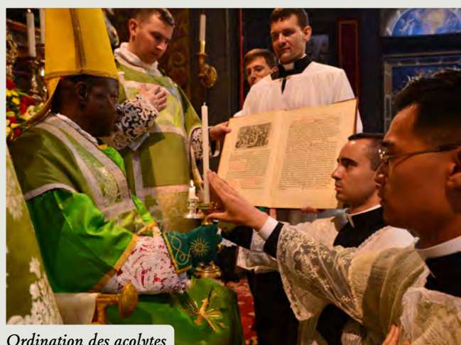
Ordination des acolytes