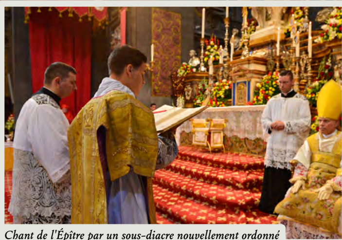
Chant de l'Épître par un sous-diacre nouvellement ordonné