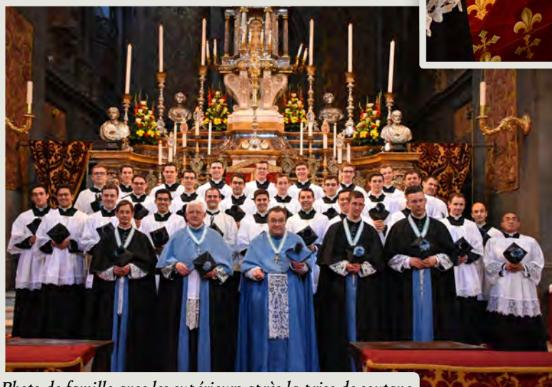
Photo de famille avec les supérieurs après la prise de soutane