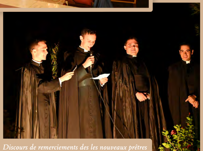
Discours de remerciements des les nouveaux prêtres