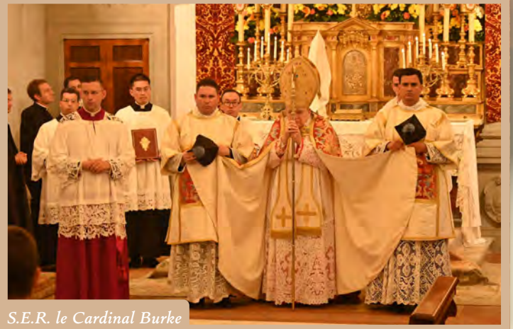
S.E.R. le Cardinal Burke

LE CHAPITRE GÉNÉRAL ANNUEL DE L'INSTITUT a réuni fin août la quasi-totalité de nos chanoines dans leur cher séminaire! Offices solennels et conférences se sont succédé dans la joie des retrouvailles.