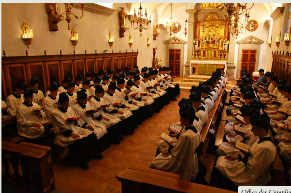
Office des Complies