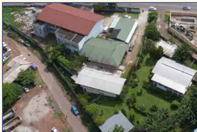
Vue aérienne de la mission en 2012 : seuls le bâtiment au toit vert et la « maison coloniale » (à droite) existaient à l'origine. Ci-dessous la maison coloniale en 2004 ; l'intérieur était à l'époque totalement en ruine...

Pendant ce temps, les activités de la paroisse se développent considérablement. Les enfants de chœur sont nombreux, les jeunes du patronage également. L'espace qui leur est réservé s'est beaucoup accru : un terrain de sport construit avec l'aide de la fondation Raoul Follereau, une salle de jeu. Les enfants occupent ainsi leur temps d'une