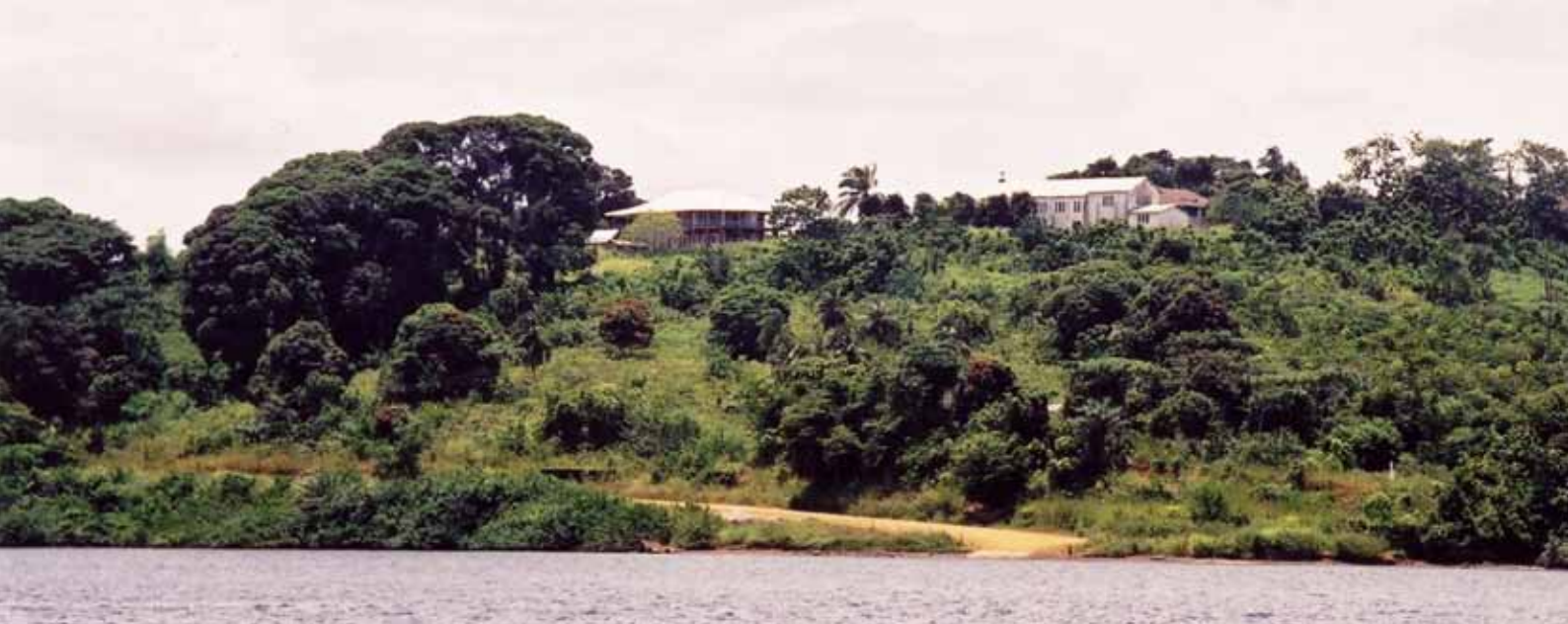
La mission de Mayumba vue de la lagune. Au pied de la mission s'achevait la Route nationale 6 (piste en latérite) arrivant de Tchibanga, jusqu'à la construction d'un pont en 2014.

pour quelques villages : Mambi, Mallembé, Mboukou, Tya, Rinanzala, Yoyo, Ndindi.