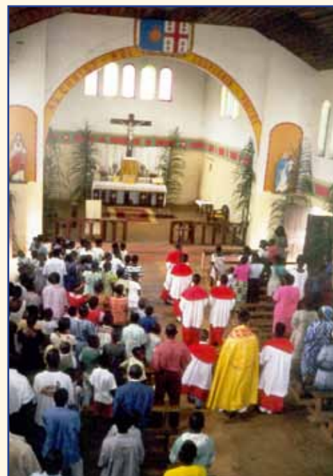
Messe dans l'église Sainte-Odile

Cette grande mission, dotée d'une vue imprenable sur la lagune et sur la mer, a connu son heure de gloire au début du XX e siècle, alors qu'elle était à la fois école, dispensaire, petit séminaire et... bananeraie. Le cimetière qui borde la mission témoigne des sacrifices des prêtres et des religieuses morts d'accès de