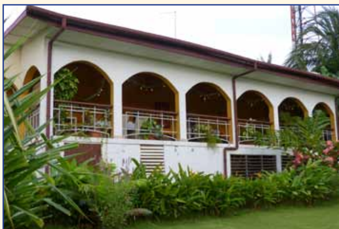
... et ci-dessus la même maison dix ans après, entièrement rénovée et rebaptisée maison des chanoines. Trois grandes pièces ont été aménagées, libérant autant d'espace dans la maison principale pour les activités du patronage.