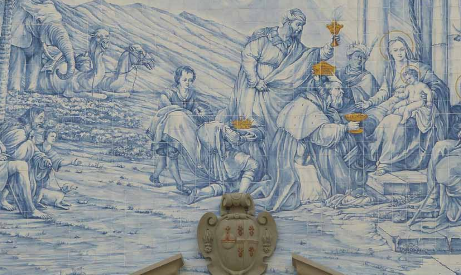
Détail de la façade de l'église : l'adoration des Mages.

architecturale développée en Andalousie au XV e siècle s'est répandue dans les Flandres et a connu son apogée au Portugal, au XVIII e siècle. Les 235 m 2 de façade sont recouverts de 11 127 carreaux dont plus de 6 000 sont ornés d'un motif détaillé. Ces carreaux de 14,5 cm de côté ont été posés en janvier 2015 par des ouvriers portugais venus tout spécialement travailler à Libreville durant la petite saison sèche.