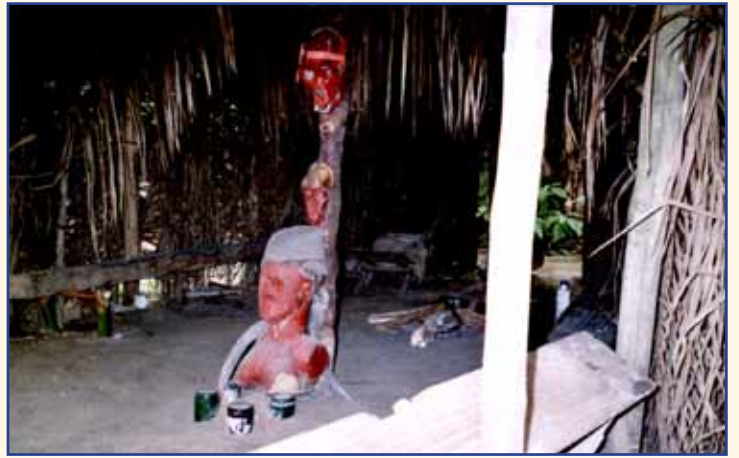
Temple Bwiti (animiste) dans un village : les pratiques rituelles sont encore solidement implantées.

Tout est traditionnel, même les méthodes d'éclairage !