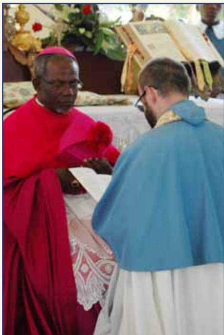
Installation le 3 mai 2009 par S.Exc.R. Mgr Basile Mvé, archevêque de Libreville, du premier curé de la paroisse, le chanoine de Ternay.

Plusieurs centaines de fidèles reçoivent les sacrements au sein de la paroisse : les jours de fête, ils sont près de 600 dans l'église. Chaque année, le curé baptise une vingtaine d'adultes et plusieurs dizaines d'enfants. De très nombreux enfants font leur première communion ou sont confirmés par l'archevêque qui visite régulièrement la paroisse.