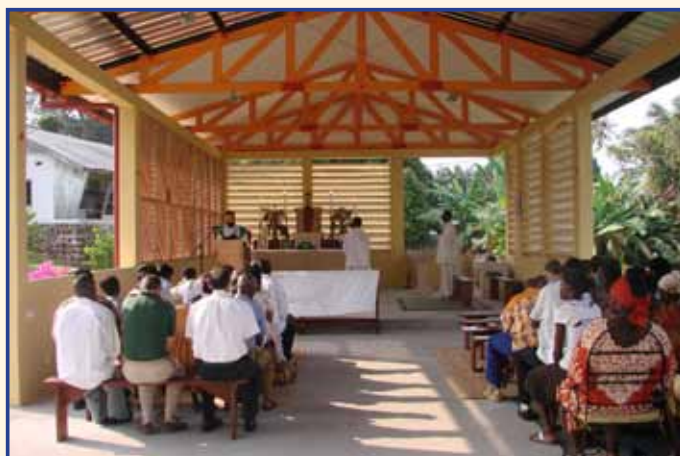
Première Messe célébrée en 2006 par le chanoine de Ternay dans la chapelle provisoire de la paroisse, tout juste aménagée. Elle servira de chapelle jusqu'en 2010.

Les cours de catéchisme, dispensés selon différents niveaux d'approfondissement, sont très suivis : une cinquantaine d'adultes, une soixantaine d'adolescents et plus de cent-vingt enfants en bénéficient. Les lieux de catéchisme ont été aménagés au fur et à mesure des besoins, de façon à ce que l'on puisse donner plusieurs cours en même temps : ils sont maintenant au nombre de trois et un quatrième est en construction.