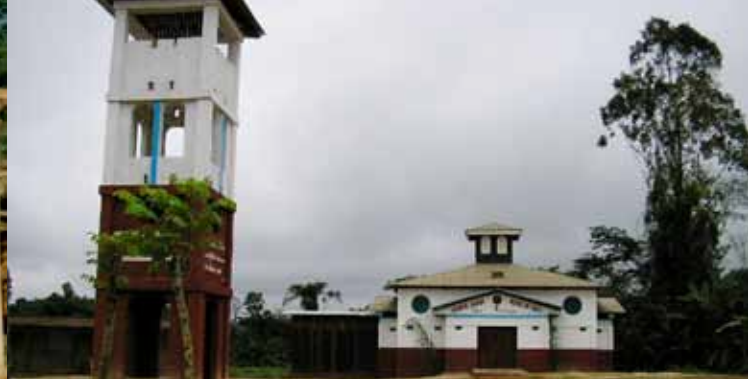
Construction de l'église de Loubomo