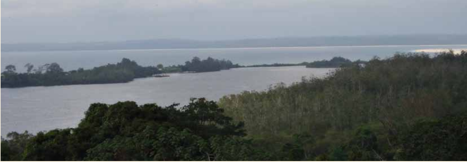
La lagune de Mayumba vue depuis la maison « Bienheureux-Daniel-Brottier »