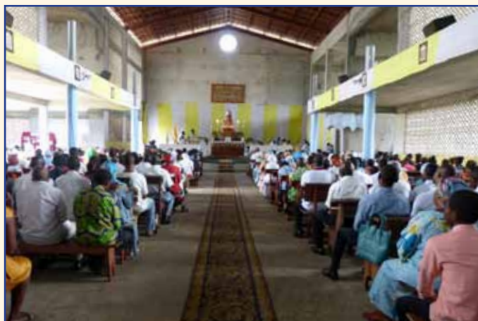
L'intérieur de l'église du Christ-Roi accueille depuis 2010 la foule des fidèles pour la Messe dominicale.

De gauche à droite : les fondations en 2006, puis les travaux en 2009, 2011, et 2015.