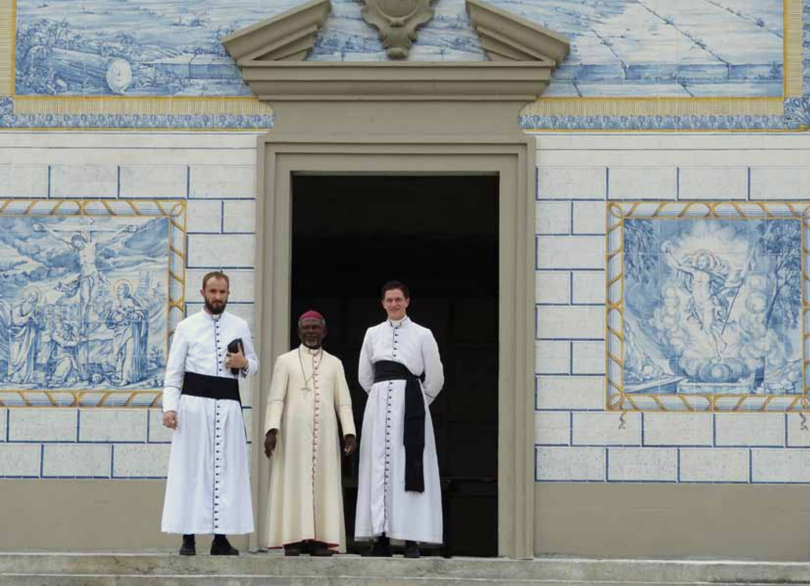
S.Exc.R. Mgr Mvé Engone, archevêque de Libreville, visitant les travaux de l'église du Christ Roi en janvier 2015.