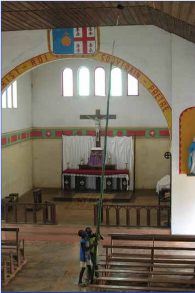
Les bambous sont heureusement de précieux auxiliaires pour le ménage des missions et des églises !

Tout est traditionnel, même les méthodes d'éclairage !