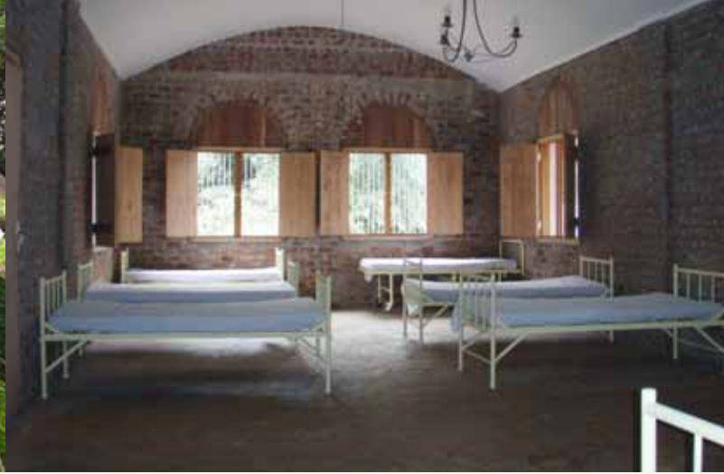
Démolition sous la conduite du chanoine de Ternay d'un bâtiment en ruine puis reconstruction du dispensaire de Mayumba, pour accueillir davantage de malades.