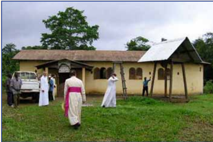
Ci-dessus, Messe célébrée par Mgr Wach dans l'église en construction : heureusement, le temps était favorable ! Quelques années plus tard devant l'église restaurée, un fidèle sonne la cloche à l'arrivée des missionnaires.