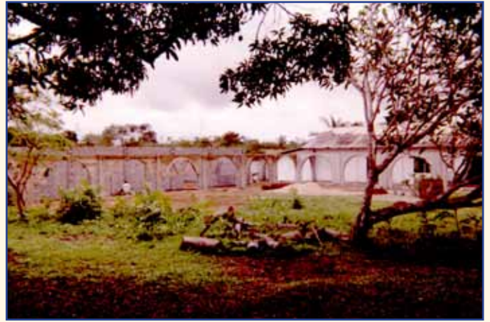
Grands travaux de 1998