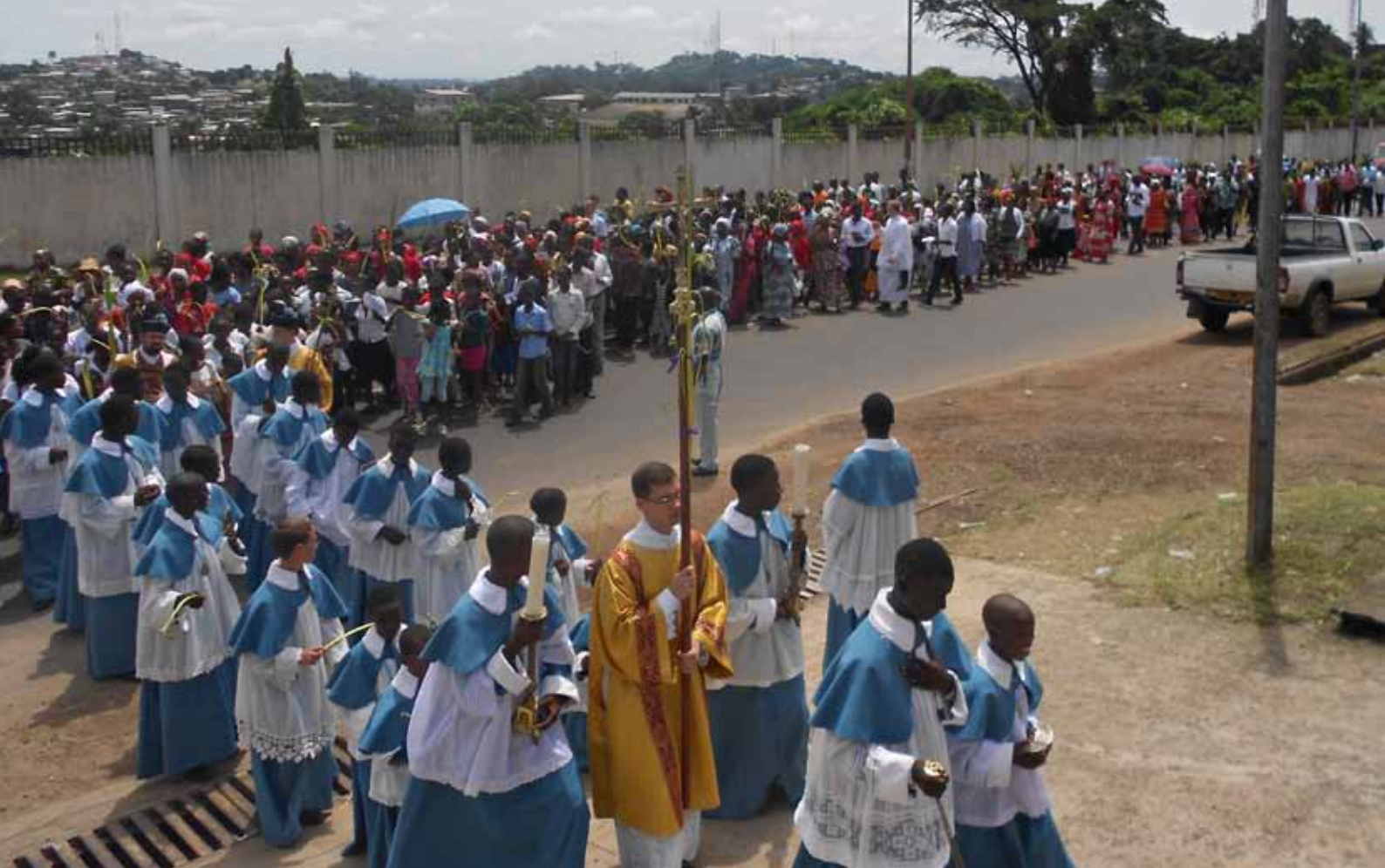
Grande procession dans les rues de Libreville pour le dimanche des Rameaux