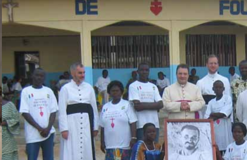
Messe à la paroisse Sainte-Thérèse de Bana, en présence des autorités civiles et militaires, suivie de l'inauguration de l'école Charles-de-Foucauld.