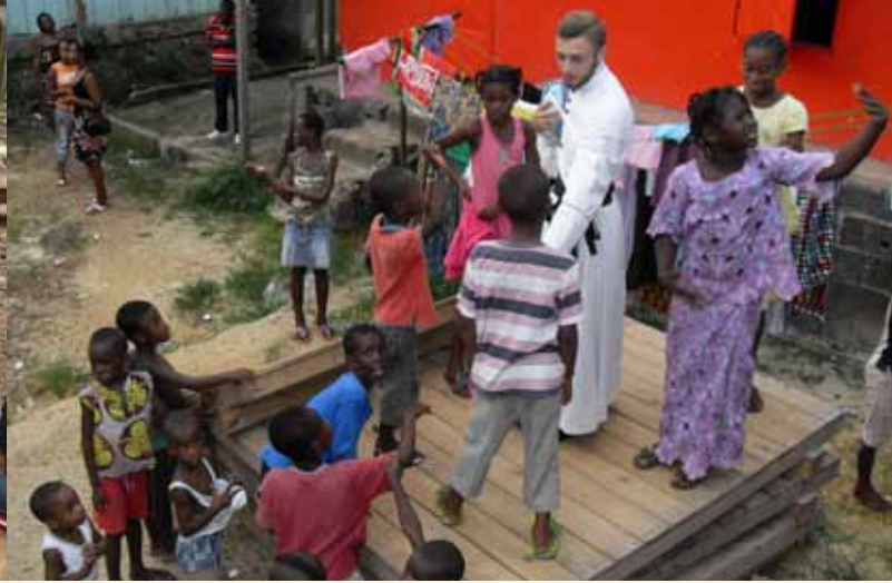
Visite dans le quartier et distribution de vêtements