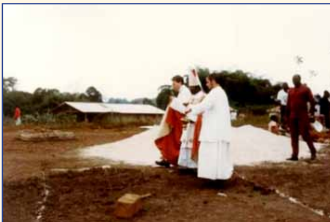
À gauche, bénédiction de la première pierre par Mgr Mvé, assisté de Mgr Wach et du chanoine Moreau ; à droite, Messe célébrée par Mgr Wach dans l'église achevée.

Cette église, la première construite dans le village, évite aux fidèles de devoir parcourir à pied le chemin qui les sépare de la mission.