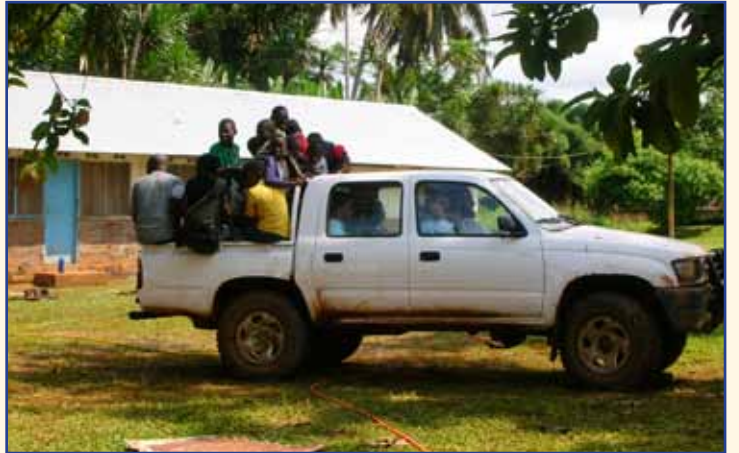
M. le Curé emmène les jeunes en promenade