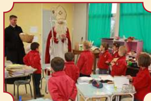
Saint Nicolas exhortant les enfants à devenir des saints

« Les années s'en vont, et l'éternité s'approche de nous : que puissions-nous tellement employer ces années en l'amour divin que nous ayons l'éternité et sa gloire. »